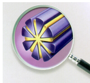
Afbeelding van uitvergroete microvezel. Hierop is duidelijk de driehoekvormige textuur van de doek te zien.

Aarzel niet uw sectorverantwoordelijke te contacteren om in de mate van het mogelijke vervanging te voorzien op die dagen. Dit kan via het telefoonnummer 070/23.30.28.